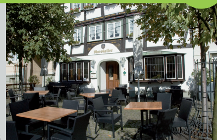
Alter Markt 36