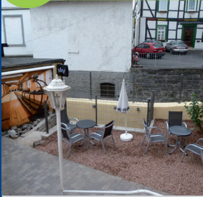
Alter Markt 18a