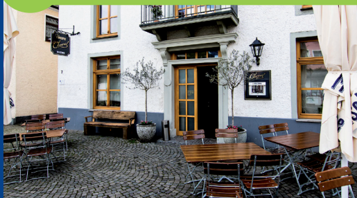
Alter Markt 7