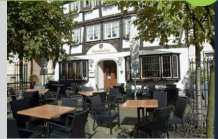
Alter Markt 36