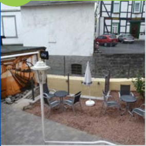
Alter Markt 18a