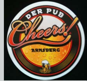
Alter Markt 7

An neuem Ort wünscht das B*wie*B Orga Team dem Cheers alles Gute !!!!